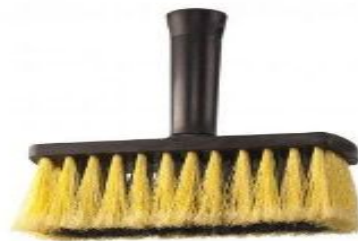
Broxa Para Pintura Retangular 15x5,6cm