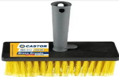
Broxa Para Pintura Cepa Grande 180x75mm Castor

BÁSICO E TERMO DE REFERENCIA E PLANILHAS EM SEUS ANEXOS.