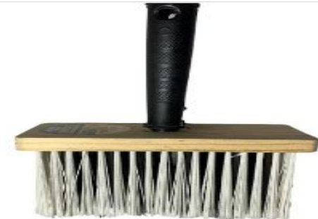
Broxa Retangular 14,5 X 6,5 - Startools