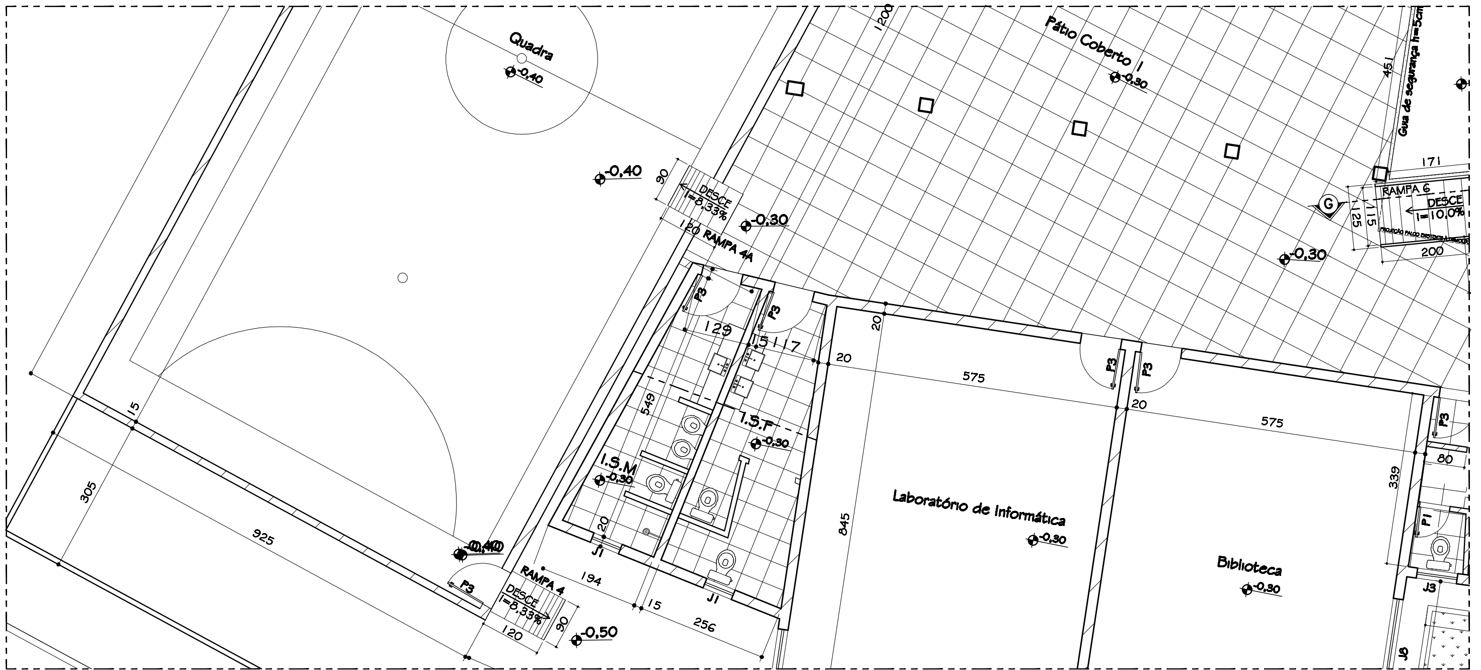
5 PLANTA BAIXA RAMPAS 4 E 4A A SEREM REFORMADOS Esc. 1:75