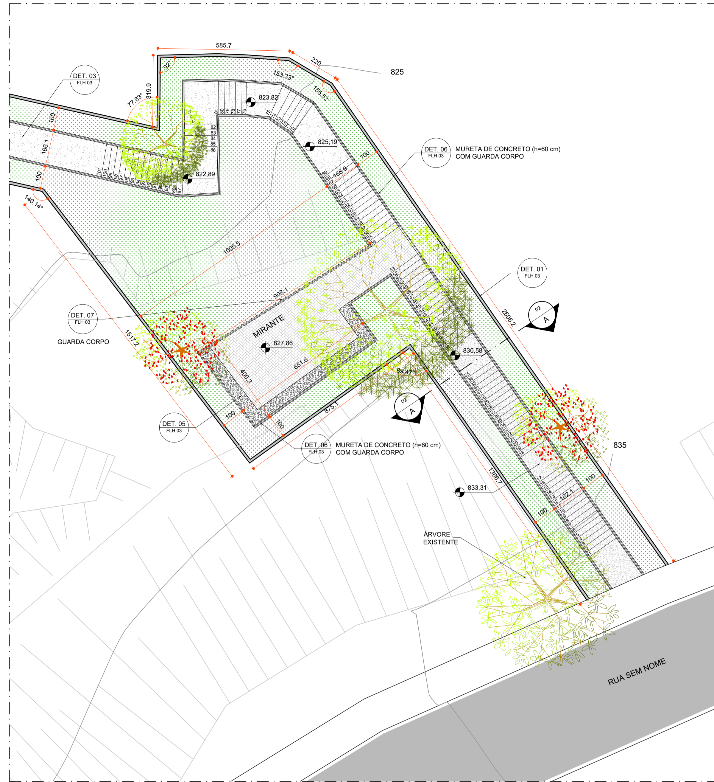
AMPLIAÇÃO 01: MIRANTE PARQUE AREÃO ESCALA: 1/100