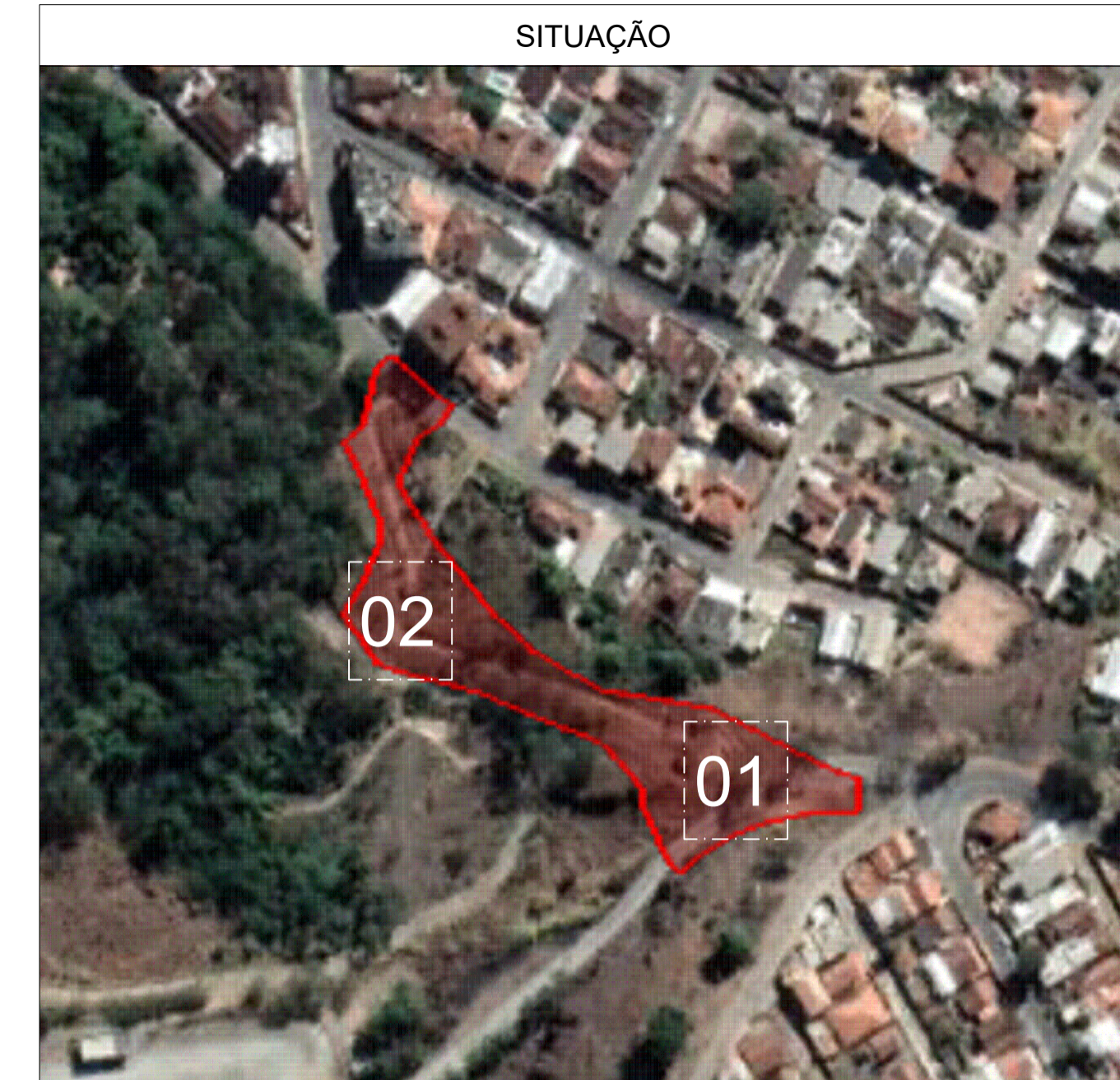
LEGENDA - IMPLANTAÇÃO